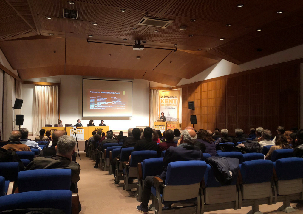
Sempozyumdan genel görüntü.