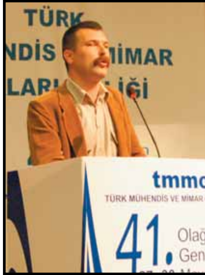
Türkiye Komünist Partisi (TKP) Genel Başkanı Erkan Baş

açlığa ve sağlıksızlığa mahkum ediyor. Bu düzen Özallar ve Dervişler'den gelen bir 'Allah kurtarsın' düzenidir" şeklinde konuştu. Kürt sorunu konusunda hem devlete hem de PKK'ye çağrıda bulunan Taş, "Vazgeç artık bu operasyonlardan. ABD ve AB'ye dayanılarak çözüm arayışından vazgeç. Bir arada yaşamı tahrip eden saldırılardan vazgeç. Otobüslerde yanan kardeşlerimiz milliyetçilerin ekmeğine yağ sürüyor" dedi. Sosyal kavganın, sınıf mücadelesinin yükseltilmesi çağrısında bulunan Alper Taş, "Şimdi dik oynamanın, daha fazla dik durmanın zamanıdır" diyerek sözlerini tamamladı.