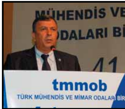
Kamu Emekçileri Sendikaları Konfederasyonu (KESK) Genel Başkanı Sami Evren

Kamu Emekçileri Sendikaları Konfederasyonu (KESK) Genel Başkanı Sami Evren, demokratik siyasi mücadelenin sadece siyasi partilerin yürüttüğü bir mücadele olmadığını belirterek, toplumun tüm örgütlü kesimlerinin yaşamın içerisinde mücadele ettikleri bir süreç olarak tanımladı. Evren, "Örgütlü halk güçleri demokrasinin teminatıdır. Bunlar olmazsa demokrasiyi parlamentoya sıkıştırmış olursunuz" dedi. Evren, Anayasa'da tüm toplumsal kesimlerin dışlanmış durumda olduğunu belirtirken, "Anayasa toplumsal bir mutabakat ise ırkçı olmamasını istiyoruz; özgürlükçü olmasını; ulaşım, eğitim, sağlık hakkı dahil toplum yararının güvence altına alınmasını istiyoruz" diye konuştu. Düşüncenin, örgütlenmenin suç olmadığı, yasakların olmadığı bir Anayasa istediklerini ifade eden söyleyen Evren, çalışan nüfusun yalnızca yüzde 5'inin sendikalaşmış olduğuna dikkat çekti. "Örgütlenme olmazsa, sendikal hareket dibe vurur" diyen Evren, 1500 Kürt siyasetçinin, 20'ye yakın sendika başkanı ve üyesinin tutuklu bulunduğunu, binlerce üyelerinin sendikal faaliyet nedeniyle soruşturma geçirdiğini, kamuda yoğun bir kadrolaşma yaşandığını, 6.5 milyon kişinin işsiz olduğunu ve işsizliğin de giderek arttığını kaydetti. Çalışma ortamında iş güvenliğinin de bulunmadığına dikkat çeken Evren, tüm bunlara karşı ortak mücadele gerektiğini ifade etti. Evren, "Kürt