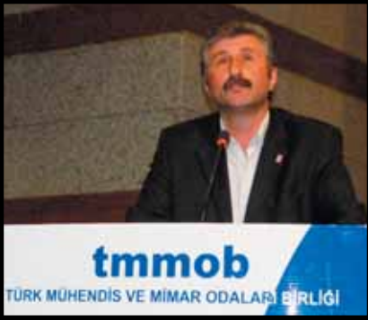
Özgürlük ve Dayanışma Partisi (ÖDP) Genel Başkanı Alper Taş

taşeronlaştırma, güvencesiz çalışmanın durdurulması başta olmak üzere tüm taleplerin hala varlığını sürdürdüğüne dikkat çekti. Tüzel, TMMOB'nin enerji özelleştirilmelerinden, suyun ve doğanın talanına karşı olmak üzere bir dizi çalışma yürüttüğüne değinerek, TMMOB'nin, ısrarlı mücadelesi nedeniyle iktidarın tepkisine maruz kaldığını söyledi.