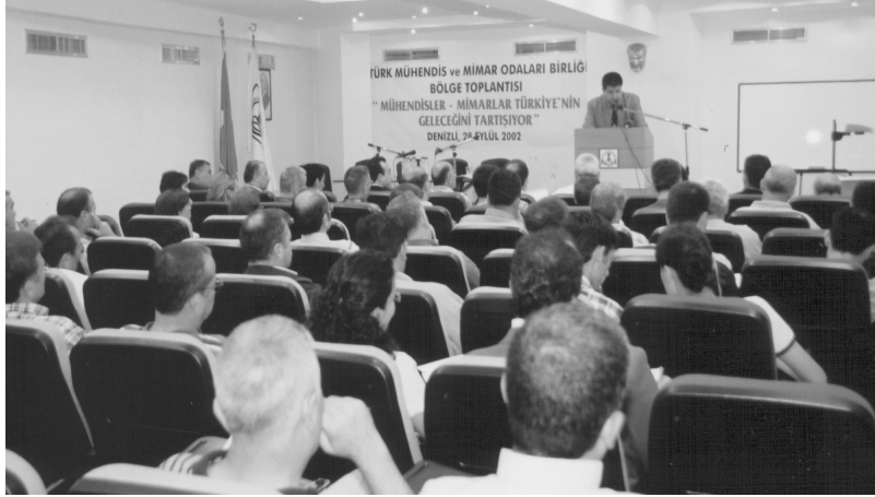
Denizli’de 28 Eylül 2002 tarihinde gerçekleştirilen bölge toplantısından bir görünüm

TMMOB Bölge toplantılarını basına ve kamoyuna 21 Eylül 2002 tarihinde yaptığımız bir basın açıklaması ile duyurduk. Aşağıda açıklamayı sunuyoruz.