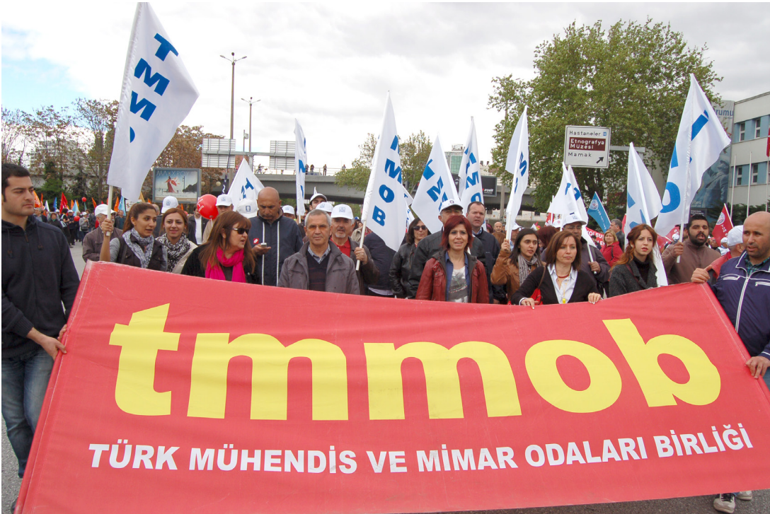
1 Mayıs 2014, Ankara