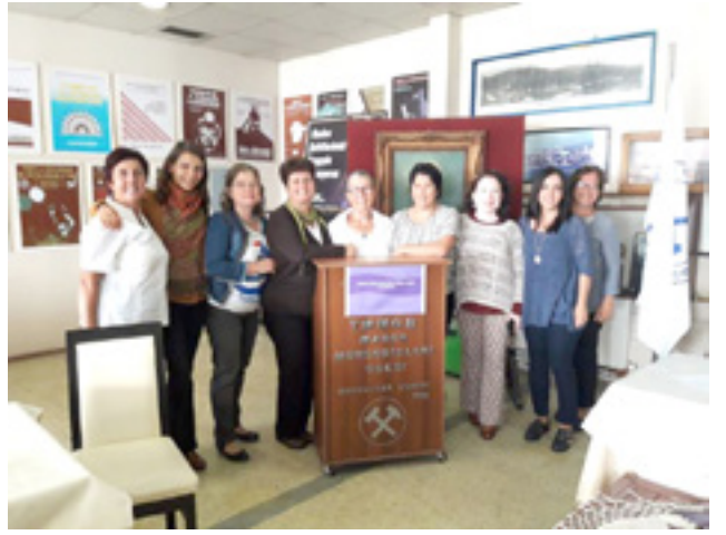
ZONGULDAK YEREL KURULTAYI 07 Ekim 2017