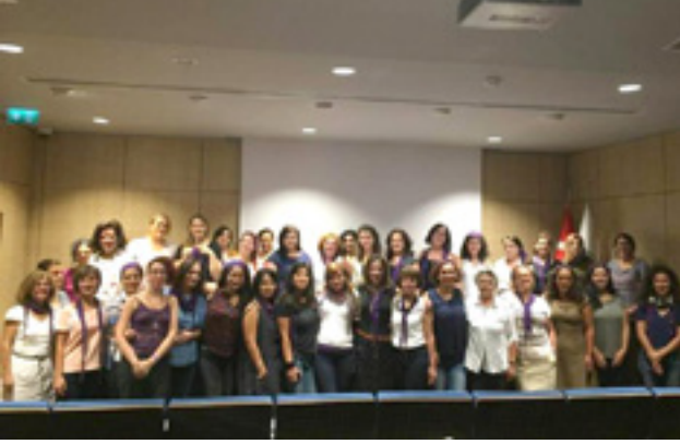
İSTANBUL YEREL KURULTAYI 24 Eylül 2017