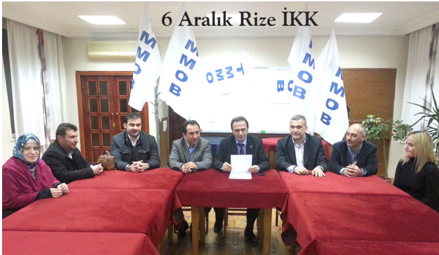
6 Aralık Rize İKK