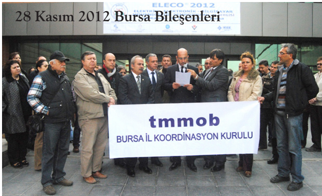
28 Kasım 2012 Bursa Bileşenleri

28 Kasım 2012 Kocaeli İKK, İstanbul İKK ve TMMOB Bursa Bileşenleri; 1 Aralık 2012 Zonguldak İKK; 4 Aralık 2012 Antalya İKK, Eskişehir İKK; 5 Aralık 2012 İzmir İKK, Mersin İKK; 6 Aralık 2012 Adana İKK, Rize İKK; 7 Aralık 2012 Diyarbakır İKK, Balıkesir İKK, Samsun İKK; 10 Aralık 2012 Van İKK, Kırklareli İKK; 11 Aralık 2012 Edirne İKK; 13 Aralık 2012 Manisa İKK; 18 Aralık 2012 Bolu İKK ve Şanlıurfa İKK, 19 Aralık 2012 tarihinde Kocaeli İKK basın toplantısı düzenleyerek konuya ilişkin açıklama yaptılar.