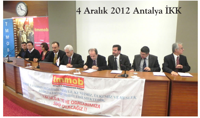
4 Aralık 2012 Antalya İKK