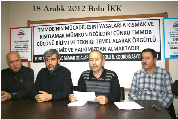
18 Aralık 2012 Bolu İKK