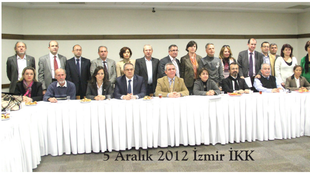
5 Aralık 2012 İzmir İKK