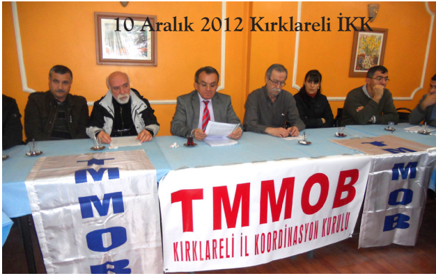
10 Aralık 2012 Kırklareli İKK