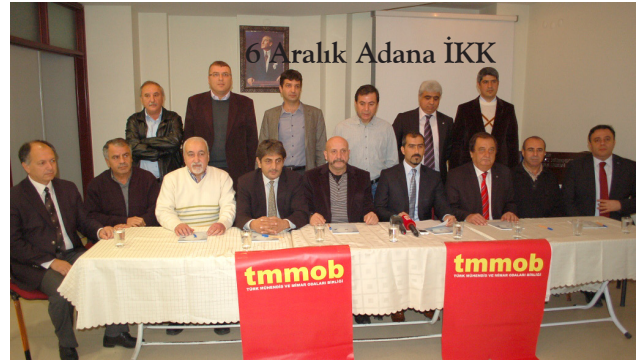
6 Aralık Adana İKK