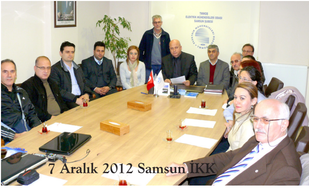
7 Aralık 2012 Samsun İKK