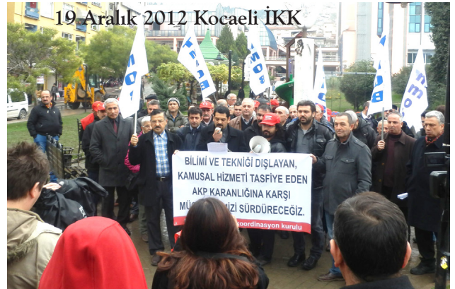
19 Aralık 2012 Kocaeli İKK