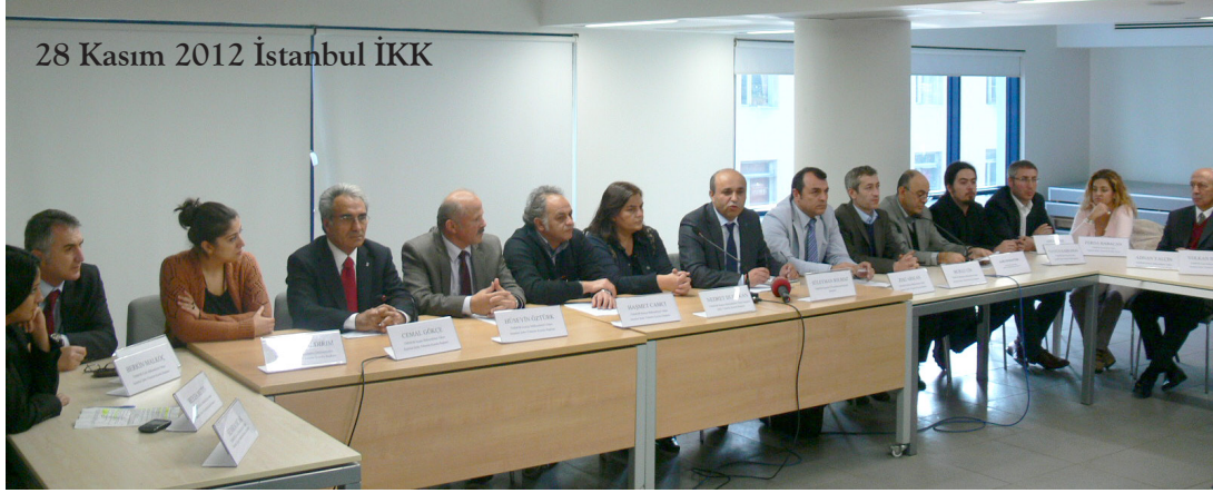
28 Kasım 2012 İstanbul İKK

28 Kasım 2012 Kocaeli İKK, İstanbul İKK ve TMMOB Bursa Bileşenleri; 1 Aralık 2012 Zonguldak İKK; 4 Aralık 2012 Antalya İKK, Eskişehir İKK; 5 Aralık 2012 İzmir İKK, Mersin İKK; 6 Aralık 2012 Adana İKK, Rize İKK; 7 Aralık 2012 Diyarbakır İKK, Balıkesir İKK, Samsun İKK; 10 Aralık 2012 Van İKK, Kırklareli İKK; 11 Aralık 2012 Edirne İKK; 13 Aralık 2012 Manisa İKK; 18 Aralık 2012 Bolu İKK ve Şanlıurfa İKK, 19 Aralık 2012 tarihinde Kocaeli İKK basın toplantısı düzenleyerek konuya ilişkin açıklama yaptılar.