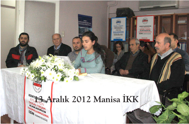
13 Aralık 2012 Manisa İKK