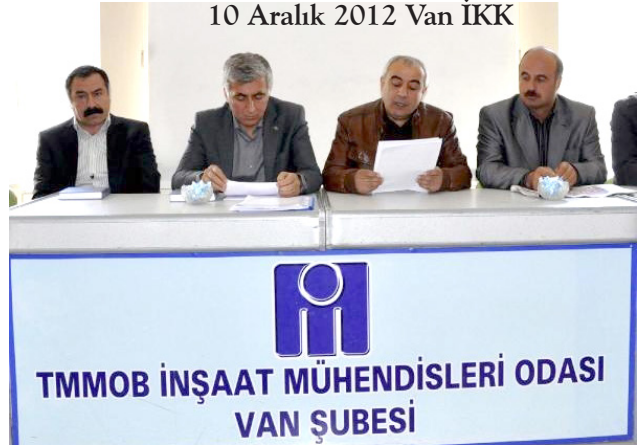
10 Aralık 2012 Van İKK