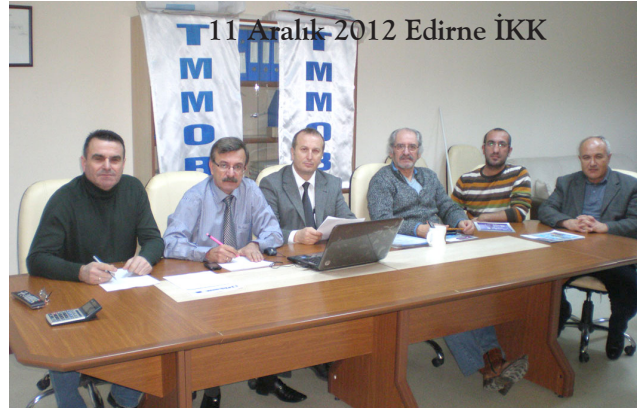
11 Aralık 2012 Edirne İKK