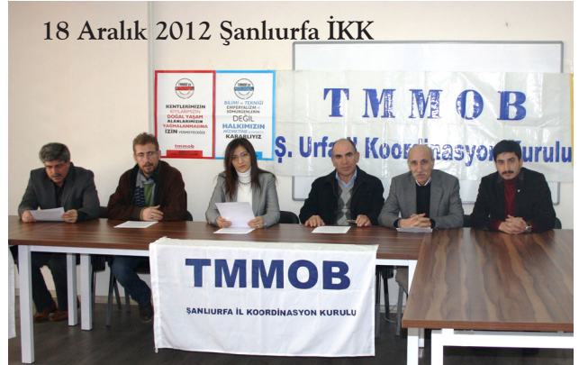
18 Aralık 2012 Şanlıurfa İKK