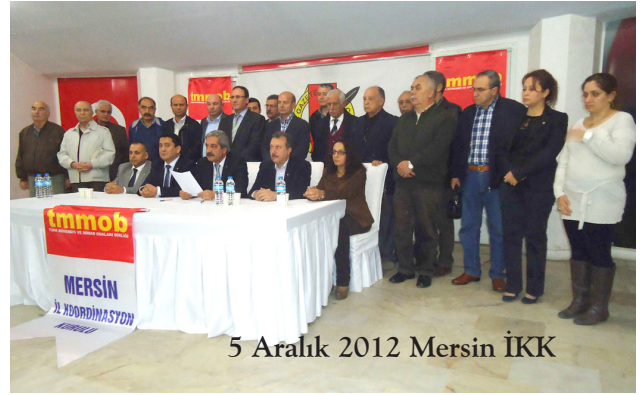
5 Aralık 2012 Mersin İKK