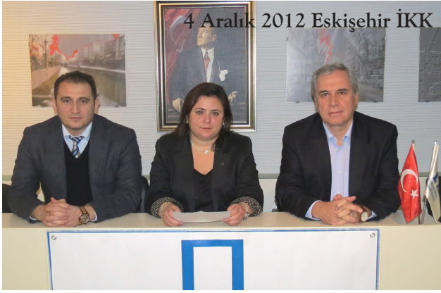
4 Aralık 2012 Eskişehir İKK