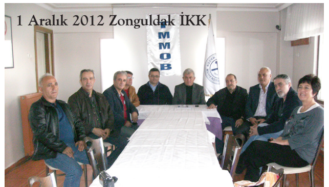
1 Aralık 2012 Zonguldak İKK