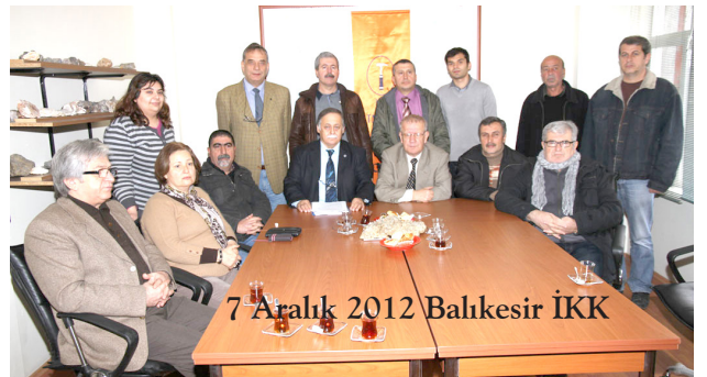
7 Aralık 2012 Balıkesir İKK