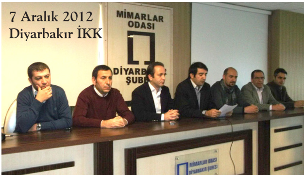
7 Aralık 2012 Diyarbakır İKK