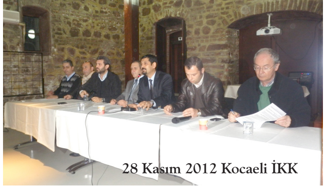
28 Kasım 2012 Kocaeli İKK

TMMOB Yasası değişikliğine karşı kamuoyunun konuya dikkatini çekmek için birçok ilde İKK'lar tarafından basın toplantıları, meşaleli yürüyüşler düzenlendi. Açıklamalarda kapalı kapılar ardında hazırlanan yasa değişikliğinin kabul edilmeyeceğini vurgulanarak, TMMOB'ye yönelen her türlü tasfiye girişimine karşı birlikte ve yan yana durulacağını altı çizildi.