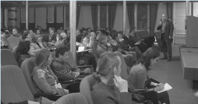
TMMOB Jeoloji Mühendisleri Odası İstanbul Şubesi yürütücülüğünde 2. İstanbul'un Jeolojisi Sempozyumu

16-18 Aralık 2005 tarihlerinde gerçekleşti