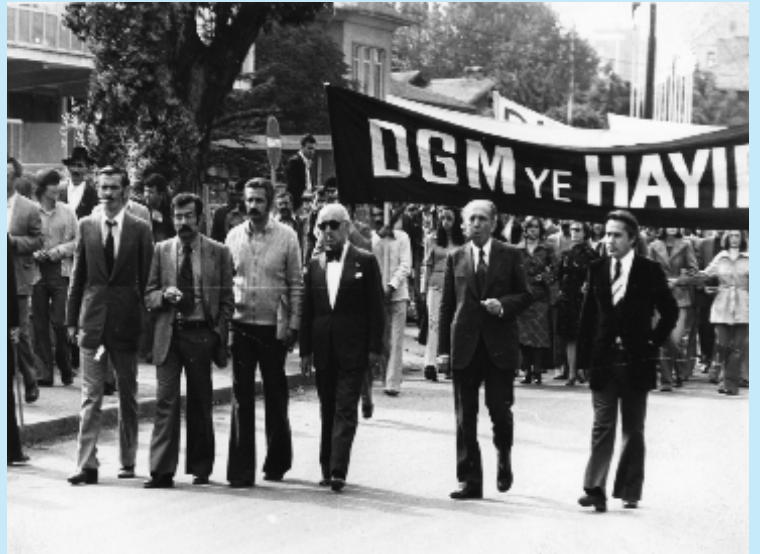
DGM'ye Hayır Miting ve Yürüyüşü / 27 Eylül 1976

"Yüreğimizdeki insan sevgisini ve yurtseverliği; baskı, zulüm ve engelleme yöntemlerinin söküp atamayacağını bilinci içinde; bilimi ve tekniği emperyalizmin ve sömürgeciğin değil, halkımızın hizmetine sunmak için" her çabayı güçlendirerek sürdürme yolunda inançlı ve kararlıyız"