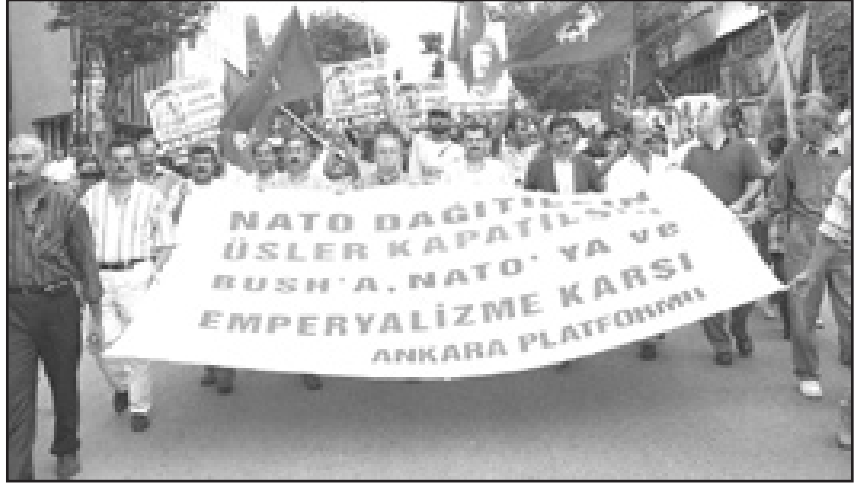
23 Haziran 2004 / ABD Büyükelçiliği

Platform bileşenleri 11 Haziran 2004 tarihinde Ankara Adliyesi önünde kitlesel basın açıklaması gerçekleştirdikten sonra "insanlığa karşı işlenmiş suç kapsamında olan işgal, yağma, soykırım, kitle katliamı, işkence ve tecavüz suçları"ndan dolayı ABD Başkanı George W. Bush hakkında Ankara Cumhuriyet Savcılığı'na suç duyurusunda bulundu.