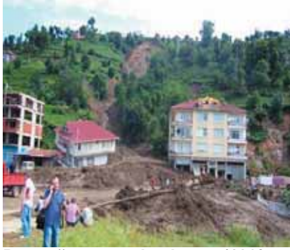
Dere ağzına yapılan konut (180° ters dönmüş)

ayrışmış birimler ile onun altında ayrışmamış birimler arasındaki geçirimlilik farklılığının olduğu, vadilerde suyun aşındırma etkisi de dikkate alındığında; topografik eğimin dik veya fazla olduğu bölgelerde; kaya zeminlerin üzerinde yer alan toprak zeminlerin kendi ağırlıkları altında akarak heyelanlara neden olduğu tespit edilmiştir.