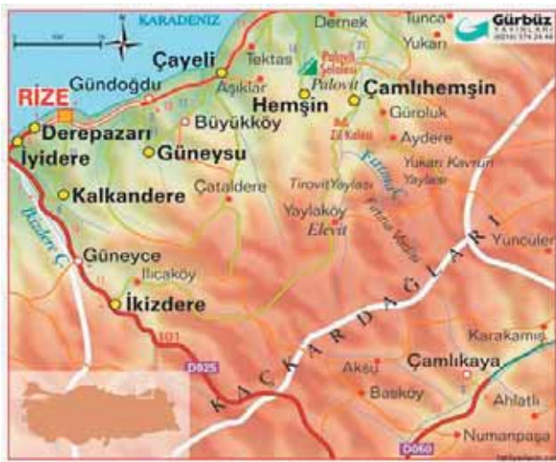
Şekil 1- Bölgenin Coğrafi Haritası

26-27 Ağustos 2010 tarihlerinde yaşanan heyelan ve sel baskını sonucunda can ve mal kayıplarının yoğun olarak yaşandığı Gündoğdu Beldesi; Rize il merkezinin doğusunda İl merkezine yaklaşık 5-6 km. mesafede, dar bir kıyı şeridinde paralel olarak gelişmiş, güney kısmı topografik olarak oldukça dik eğimli bir şekilde yükselerek devam eden ve doğu Karadeniz dağları ile bu dağların üzerinde parçalanma sonucu oluşmuş çok sayıda dere ve çay yataklarının oluşturduğu küçük aluviyal düzlükler ve vadi yamaçları ile küçük dere yatakları üzerine kurulmuştur. Belde 4-5 km. uzunluğunda dar bir şerit şeklinde uzanmakta olup, 5 mahalle ve 14 köyden oluşmaktadır. (Şekil-1)