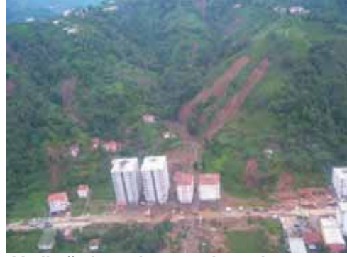
Vadi ağzlarını kapatan konutlar