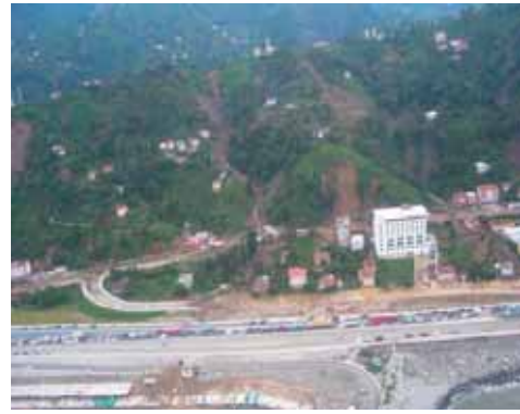
Karadeniz otoyolunun oluşturduğu sedde