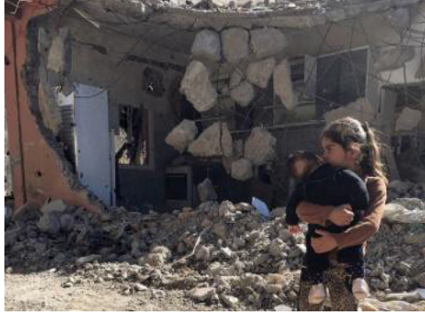
Fotoğraf 8-9-10. Halk yıkık evlerinden, mahallerinden ayrılmamıştır.

Yıkımın boyutu ne kadar fazla da olsa, özellikle kadınların bir an önce evlerindeki yaşantılarına geri dönebilmek, çocuklarının ihtiyaçlarına cevap olabilmek düşüncesi içinde olduğu anlaşılmıştır. Aileler ya akraba, komşu gibi yakınlarının evlerinde ya da orta-az hasarlı evlerinde kalarak kendi imkânları ile hasarı gidermeye ve yaşama devam etmeye çalışmışlardır.