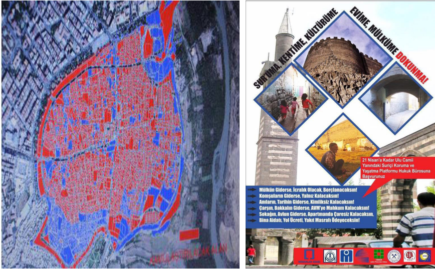
Fotoğraf 33-34. Suriçi Bölgesi Acele Kamulaştırma haritası ve TMMOB Diyarbakır İKK bilgilendirme broşürü.

Diyarbakır Suriçi bölgesinin kentsel sit alanının tamamı (çatışmaların olmadığı mahallelerde) yaklaşık % 82'si Bakanlar Kurulu kararıyla 21.03.2016 Acele Kamulaştırma kapsamına alındı. Böylece alanda toplamda 363 ada, 6300 parsel kamulaştırılma kapsamına alınmış oldu. Bu kararla alanda kamusal kullanımdaki tarihi camiler, kiliseler, hanlar, hamamlar, çeşmeler, meydanlar ve halkın özel mülkiyetleri kamulaştırma kapsamına alındı. Suriçi bölgesinde kayıtlı bulunan yaklaşık 59 bin kişinin zorunlu yerinden edilmesine neden olan kararın iptali için Diyarbakır TMMOB İKK olarak bilgilendirme afişleri ve itiraz davaları açıldı(Fotoğraf: 33-34).