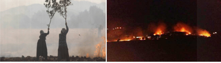
Fotoğraf :6-7 Bu süreçte bölgede yaşanan orman yangınları görüntüleri.

tarihinde basınla paylaşılan “Çatışmalı Ortamda Ekolojik Tahribat Raporu”na göre ormanlık alanlar, bağ evleri, üzüm bağları, bostanlar, meyve bahçeleri yakılmış, çok sayıda büyükbaş ve küçükbaş hayvan telef edilmiştir. Öyle ki bazı yerlerde geçim kaynağı olan hayvanlardan geriye kalanların otlatılacağı alanlar dahi kalmamıştır. (Fotoğraf 6-7)