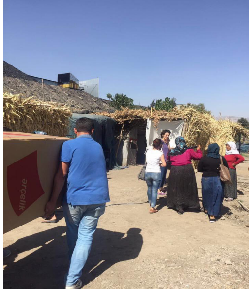
Fotoğraf 30-31. Buzdolabı kampanyası afişi ve dolapların dağıtımı.

TMMOB Mimarlar Odası Diyarbakır Şubesi çatışmaların yaşandığı kentlerde mağdur olan özellikle kadın ve çocukların temel gıda ve insani ihtiyaçların karşılanmasına yönelik dayanışma kampanyası yürütmüştür (Fotoğraf 32).