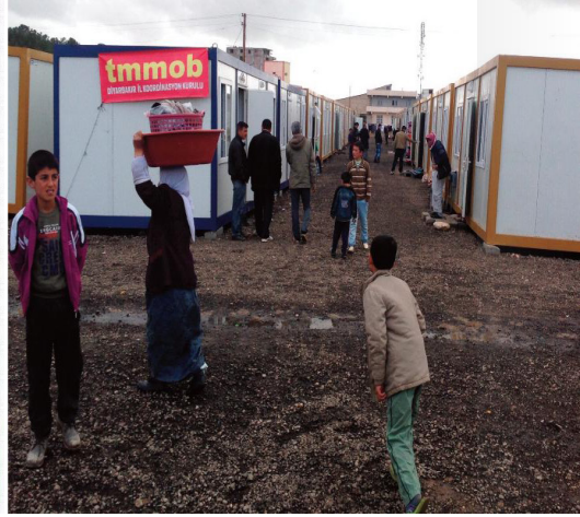
Fotoğraf 27-28. 'Kış kapıda Şengal ve Kobanê dışarıda! Kampanya brořurü ve konteynır yerleřimi görüntüsü.

Bilimi ve teknięi esas alan, kentlerin kimlięini özümseyerek, meslek alanlarına yönelik her türlü yardımlařma ve dayanışma duygusuyla hareket eden, halkların sorunlarının meslek/meslektař sorunlarından ayrılmayacaęı ve kamusal sorumluluk gerçeęiyle hareket eden TMMOB Diyarbakır İKK bileřenlerinin oluřturduęu 12 kiřilik heyet, Suruç Kaymakamlıęı'nın özel izniyle 11 řubat 2015 tarihinde Kobanê'yi ziyaret etmiřtir. Heyet, Mürřitpınar Sınır Kapısı'ndan Kobanê'ye giriř yapmış, sınırda Kobanê Kanton yönetimi görevlilerince karřılanmıřtır.