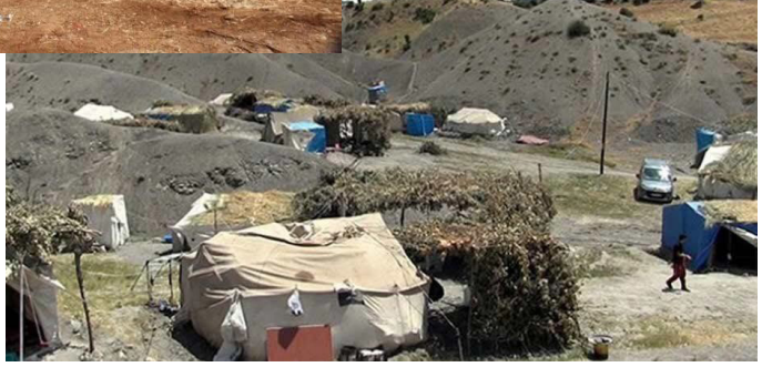
Fotoğraf 21-22. Şırnak'ta yıkım sonrası geçici barınma alanları görüntüleri