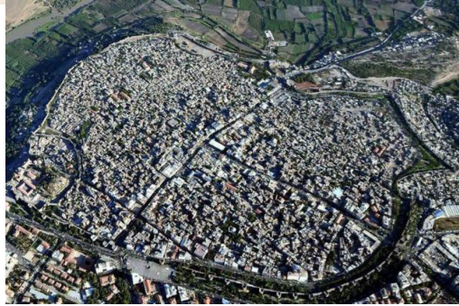
Fotoğraf 25-26. Suriçi'nin orijinal hali ve çatışmalı süreç sonrası yıkıma uğramış hali.