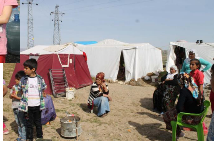
Fotoğraf 23-24. Şırnak'ta yıkım sonrası geçici barınma alanları görüntüleri