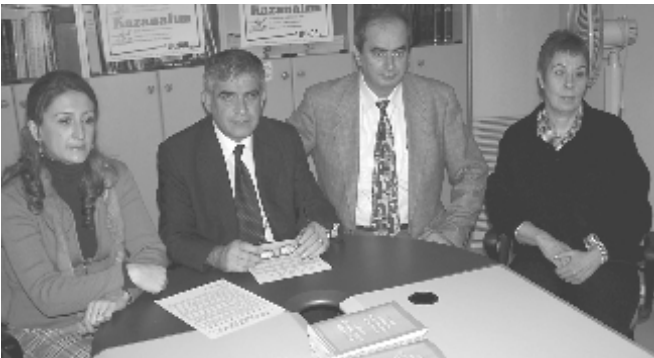
TMMOB Eskişehir İKK

Basın toplantısında ayrıca TMMOB tarafından hazırlanan “TMMOB Halkımıza Enerji Tasarrufu İçin diyor ki: Enerjiyi etkin ve verimli kullanalım” başlıklı broşürün tanıtımı yapıldı.