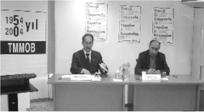
TMMOB İstanbul İKK

TMMOB, İl/İlçe Koordinasyon Kurulu Sekreterleri aracılığı ile örgütlü olunan 32 yerde, 17 Şubat 2005 tarihinde “ENERJİ TASARRUFU” ile ilgili basın toplantısı yaptı.