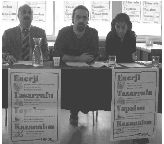
TMMOB Ankara İKK