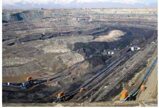
06.02.2011 Heyelanı (Fotoğraf 2)

06.02.2011 tarihinde saat 03.00 sularında meydana gelen heyelan sonucunda işletmenin güneybatı bölümünden yaklaşık 20-25 milyon m 3 malzeme ocak içine kayarak, ocak içine giden tüm yolları ve kömür naklini sağlayacak konveyör bandı kullanılamaz duruma getirmiştir. (Fotoğraf 2) Bu heyelan sırasında bir işçi hayatını kaybetmiştir.