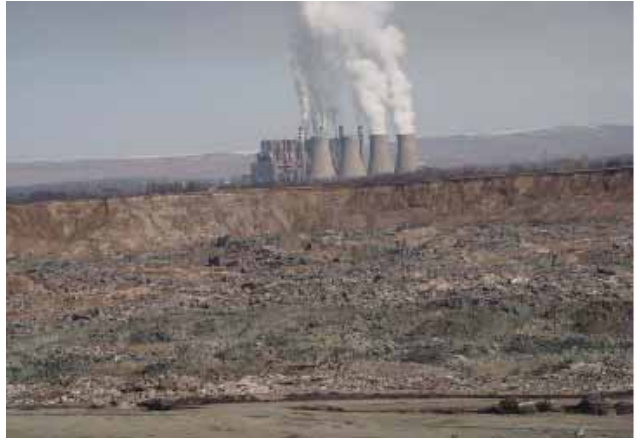
10.02.2011 Heyelanı ve A Termik Santrali (Fotoğraf 3)

10.02.2011 tarihinde sabah 10.00 sularında meydana gelen ikinci heyelan, işletmenin kuzeydoğu bölümünde yaklaşık 1000 m genişliğinde, şev başından itibaren 600 m geriye doğru yaklaşık 50 milyon m 3 malzemenin ocak içini tamamen doldurması ile sonuçlanmıştır. (Fotoğraf 3). Heyelanın ani ve çok hızlı gelişmesi sonucu şev üstünde çalışma yapan iki mühendis ve 8 işçi uzaklaşmaya fırsat bulamadan kayan malzeme içinde kalmıştır.