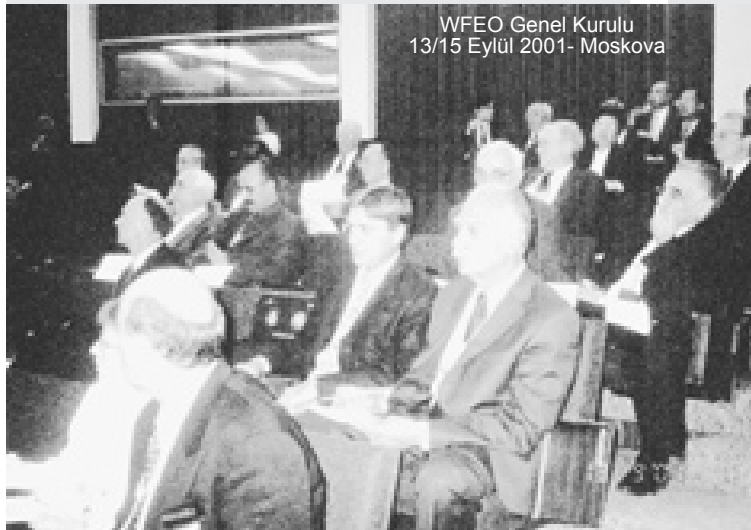
WFEO Genel Kurulu 13/15 Eylül 2001- Moskova

Emek Platformu Teknik Komite toplantısı "yeni dönem programı konusunda görüşmeler" gündemiyle yapıldı.