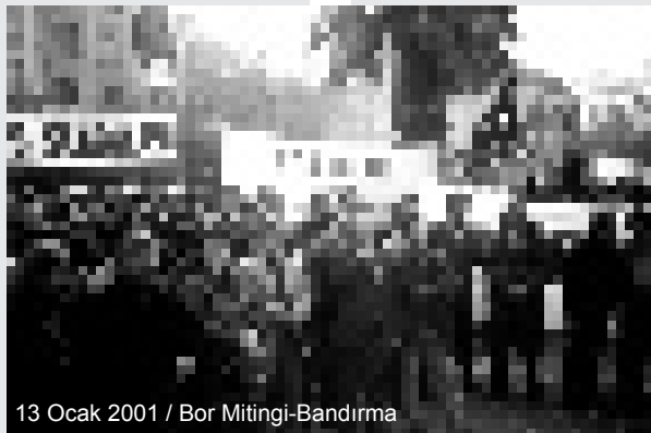
13 Ocak 2001 / Bor Mitingi-Bandırma

ETİ Bor'un özelleştirilmesine yönelik girişimler üzerine; TMMOB'ye bağlı Maden, Metalurji, Jeoloji ve Kimya Mühendisleri Odası, DİSK'e bağlı Dev Maden-Sen, TÜRK-İŞ'e bağlı Türkiye Maden-İş, Genel Maden-İş, Petrol-İş, KESK'e bağlı Maden-Sen sendikaları ve KİGEM'in katılımı ile oluşturulan Platform, bor ve özelleştirme sürecine ilişkin gerçekleri kamuoyunun ve ilgili kurum-kuruluşların bilgisine sunmak üzere çalış-