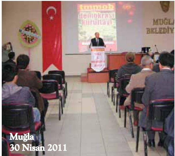
Muğla 30 Nisan 2011