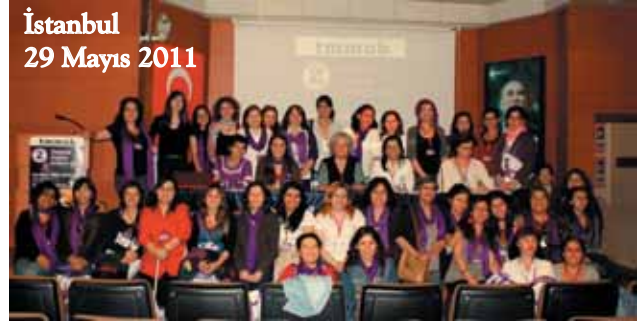
İstanbul 29 Mayıs 2011