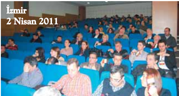
İzmir 2 Nisan 2011