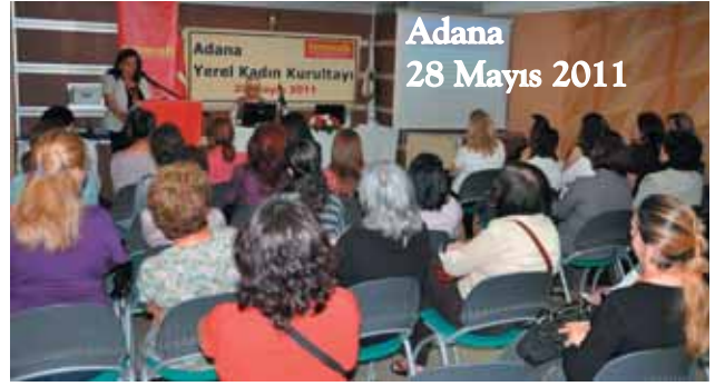
Adana 28 Mayıs 2011