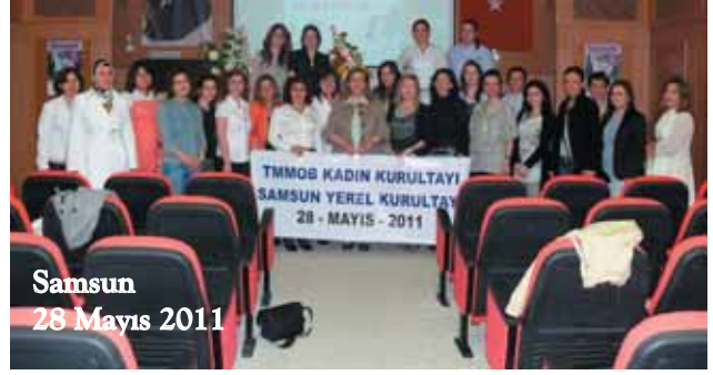
Samsun 28 Mayıs 2011