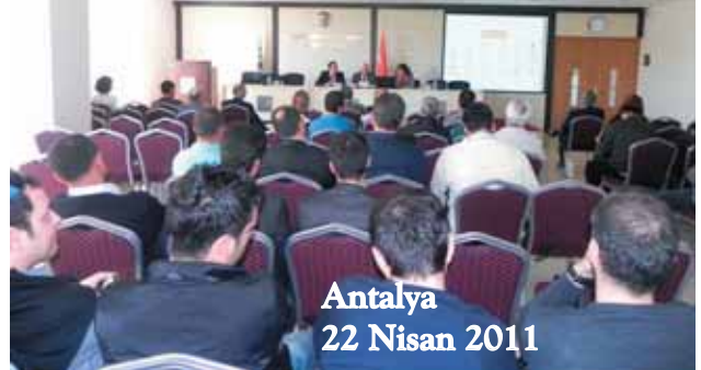
Antalya 22 Nisan 2011