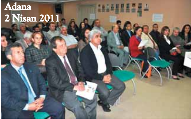
Adana 2 Nisan 2011

Yerel kurultaylarda kabul edilen karar önergeleri Düzenleme Kurulu içinde oluşturulan Kolaylaştırıcı Kurul tarafından birleştirilerek TMMOB ÜMMŞP ve İşsizlik Kurultayı'na getirilecek.