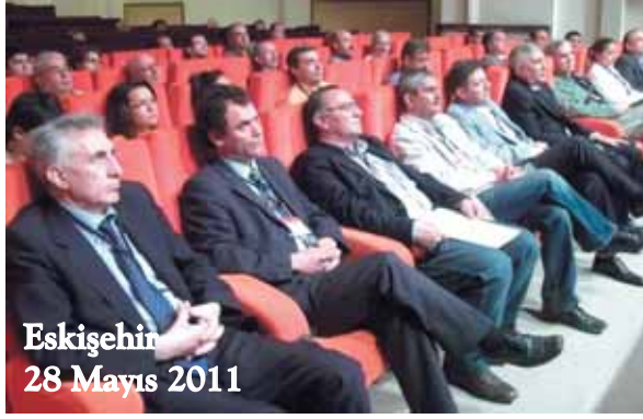
Eskişehir 28 Mayıs 2011