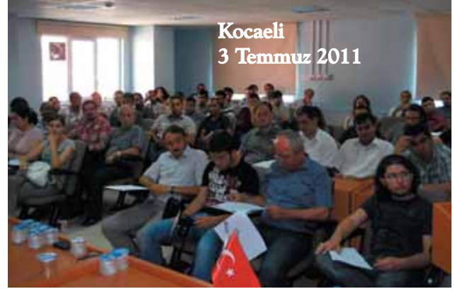
Kocaeli 3 Temmuz 2011