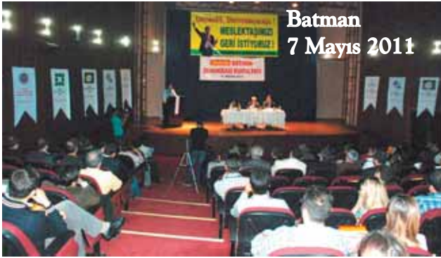
Batman 7 Mayıs 2011