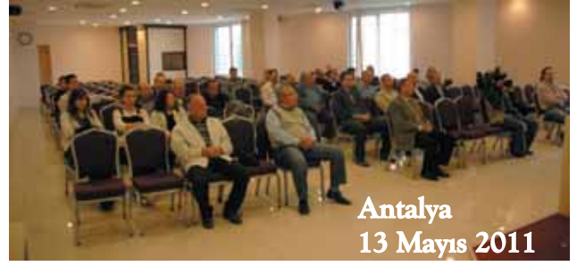
Antalya 13 Mayıs 2011