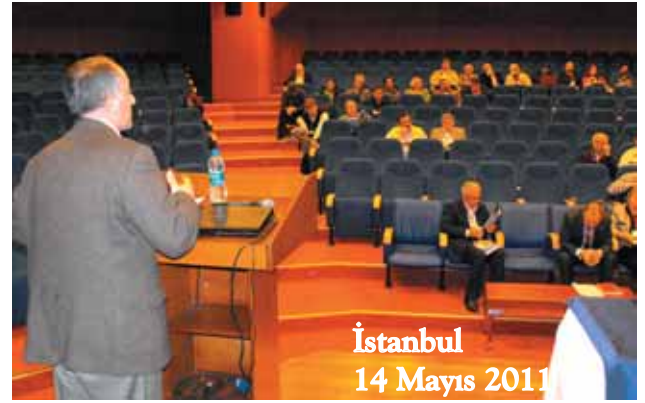
İstanbul 14 Mayıs 2011