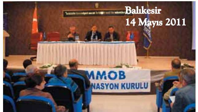
Balıkesir 14 Mayıs 2011