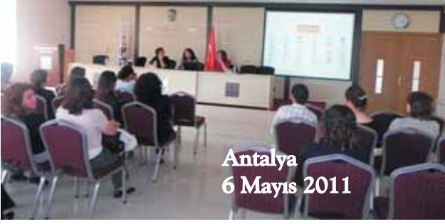
Antalya 6 Mayıs 2011