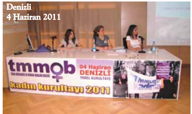
Denizli 4 Haziran 2011