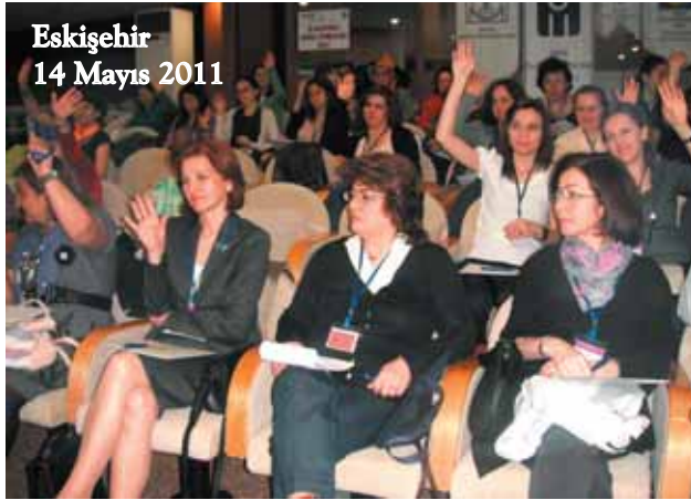
Eskişehir 14 Mayıs 2011