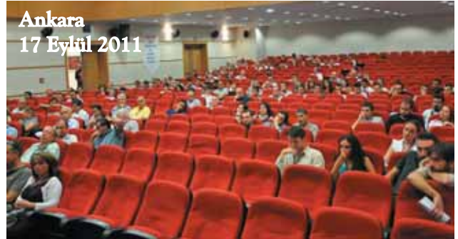
Ankara 17 Eylül 2011