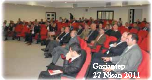
Gaziantep 27 Nisan 2011