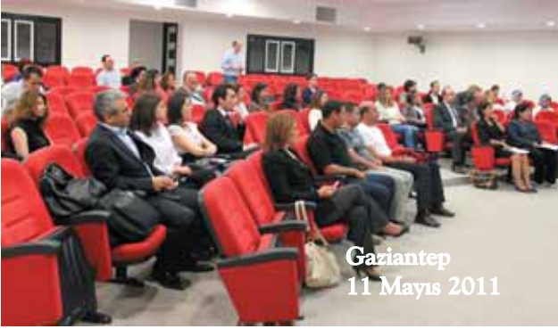
Gaziantep 11 Mayıs 2011