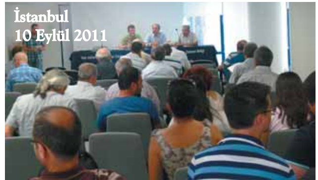
İstanbul 10 Eylül 2011