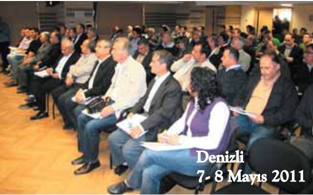
Denizli 7- 8 Mayıs 2011