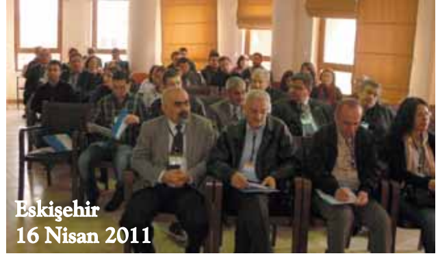
Eskişehir 16 Nisan 2011