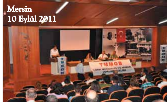
Mersin 10 Eylül 2011