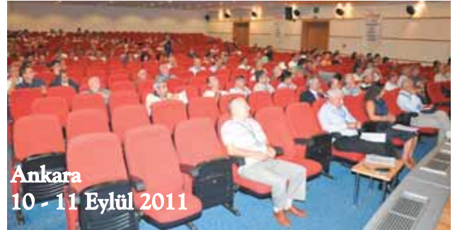
Ankara 10 - 11 Eylül 2011