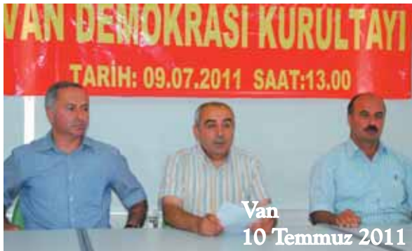
Van 10 Temmuz 2011