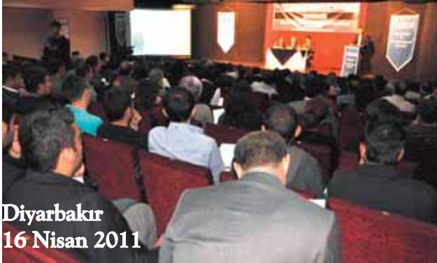
Diyarbakır 16 Nisan 2011

Yerel kurultaylarda kabul edilen karar önerileri Düzenleme Kurulu tarafından birleştirilecek ve merkezi kurultaya taşınacak.