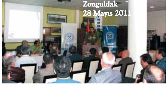
Zonguldak 28 Mayıs 2011