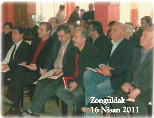
Zonguldak 16 Nisan 2011