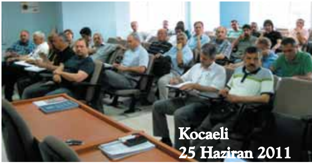
Kocaeli 25 Haziran 2011