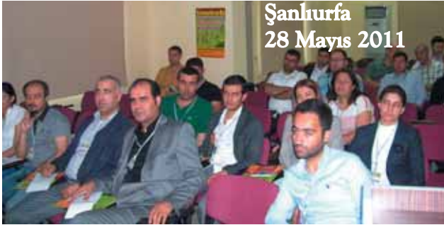
Şanlıurfa 28 Mayıs 2011