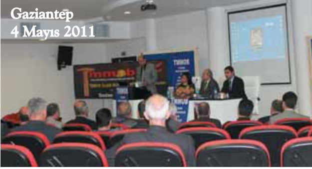
Gaziantep 4 Mayıs 2011