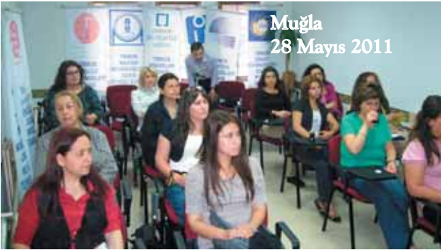
Muğla 28 Mayıs 2011