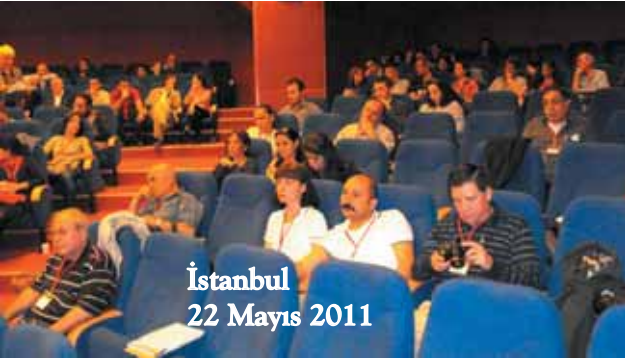
İstanbul 22 Mayıs 2011