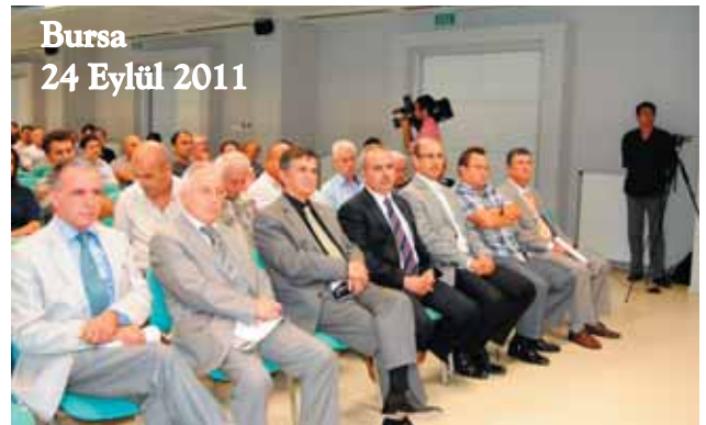
Bursa 24 Eylül 2011