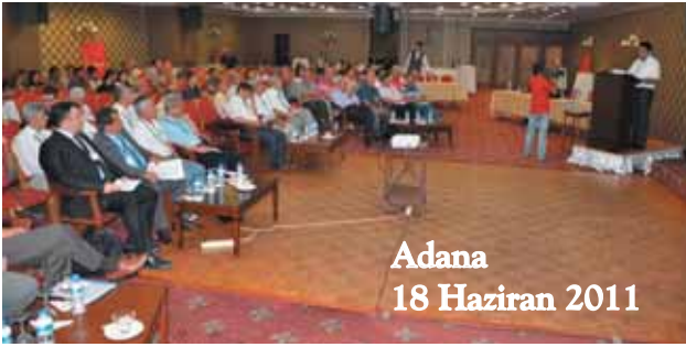
Adana 18 Haziran 2011