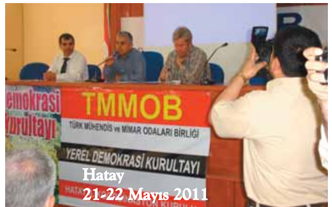
Hatay 21-22 Mayıs 2011