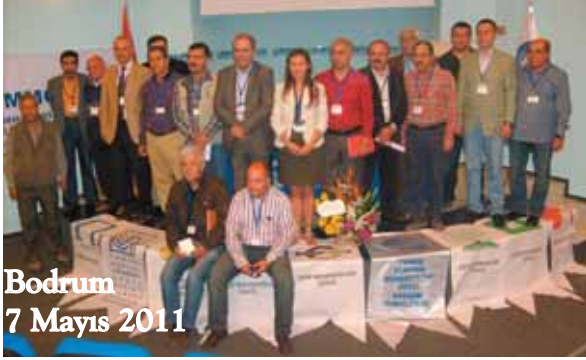
Bodrum 7 Mayıs 2011