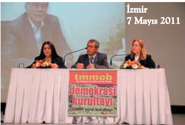
İzmir 7 Mayıs 2011