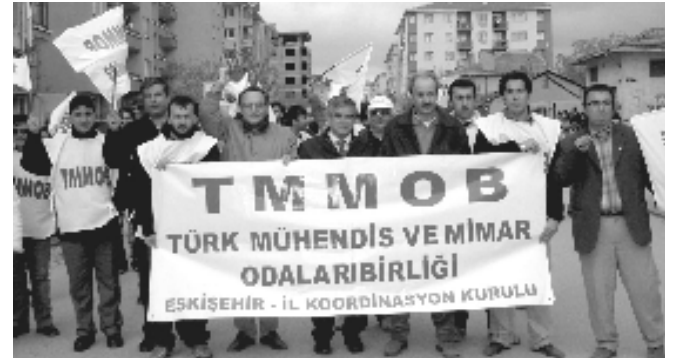
1 Mayıs Eskişehir