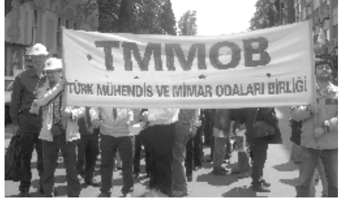
1 Mayıs İzmir