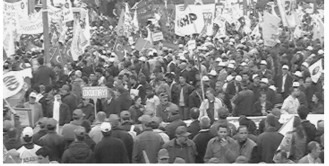
1 Mayıs İstanbul

Bu gün hep birlikte "kurtuluş yok tek başına ya hep beraber ya hiç birimiz" deme zamanıdır.